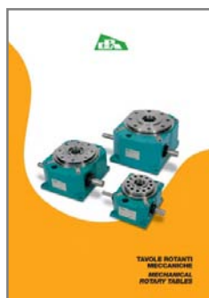
TAVOLE ROTANTI MECCANICHE MECHANICAL ROTARY TABLES