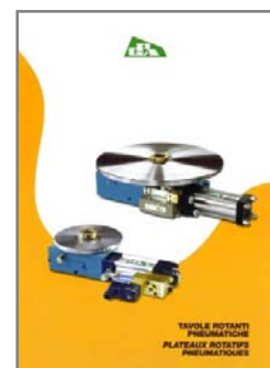
TAVOLE ROTANTI PNEUMATICHE PNEUMATIC ROTARY TABLES