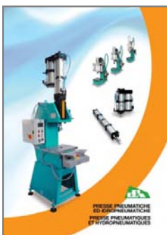
PRESSE PNEUMATICHE ED IDROPNEUMATICHE. PNEUMATIC AND HYDROPNEUMATIC PRESSES